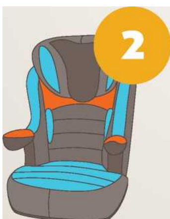
15-25 кг от 3 до 7 лет