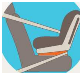
Лицом против движения