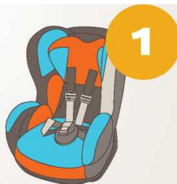
9-18 кг от 9 месяцев до 4 лет